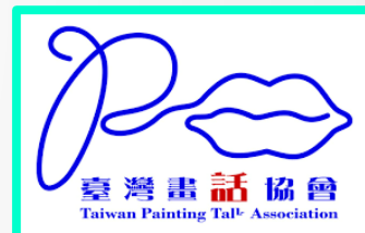
臺灣畫話協會 Taiwan Painting Talk Association