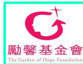
勵馨基金會 The Garden of Hope Foundation